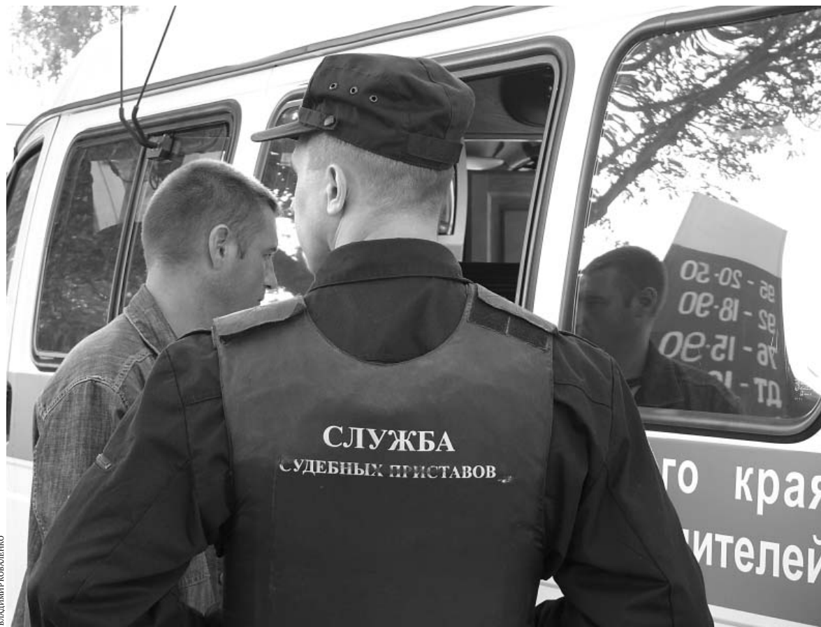
Иногда только приставы в силах заставить нерадивого родителя платить алименты.

Житель Эссентуков задолжал налогов на сумму 104 тысячи рублей. Решение суда он проигнорировал.